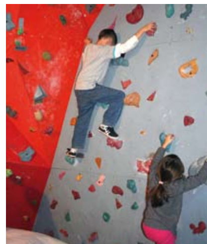
Sporo radości sprawiło dzieciom wspinanie się na specjalną ściankę wspinaczkową w „Strefie Wolności”.