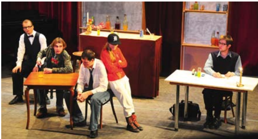
Scena ze spektaklu „Trudno nie wierzyć w nic”.

W urozmaiconym programie, w którym swoje miejsce znalazły piosenki, występy taneczne, kabarety oraz spektakl teatralny, nie zabrakło ani humoru i pozytywnej energii, ani refleksyjnej zadumy. Koncert Walentynkowy zawsze bowiem łączy w sobie stronę artystyczno-rozrywkową z głębokim przesłaniem odwołującym się do podstawowych humanistycznych wartości, które trafia do szerokiej publiczności, złożonej zarówno z uczniów cieszyńskich szkół, zaproszonych gości i wszystkich miłośników Koncertu.